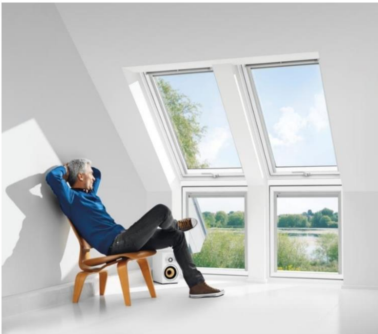
Verrières d'angle composées de fenêtres GPU et VIU