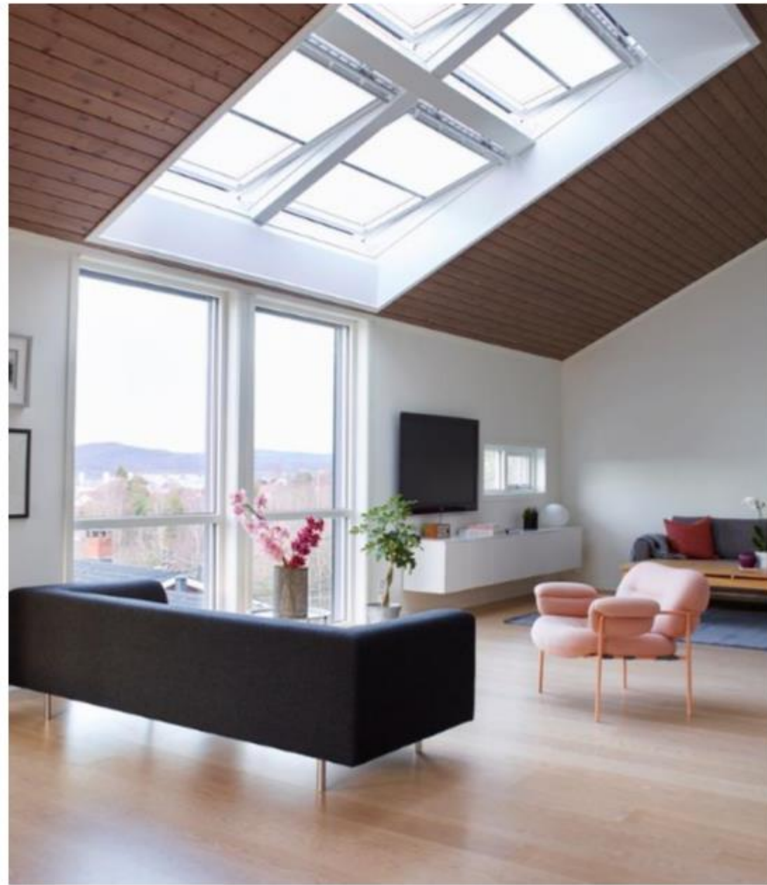
Verrière alignée avec une baie vitrée verticale