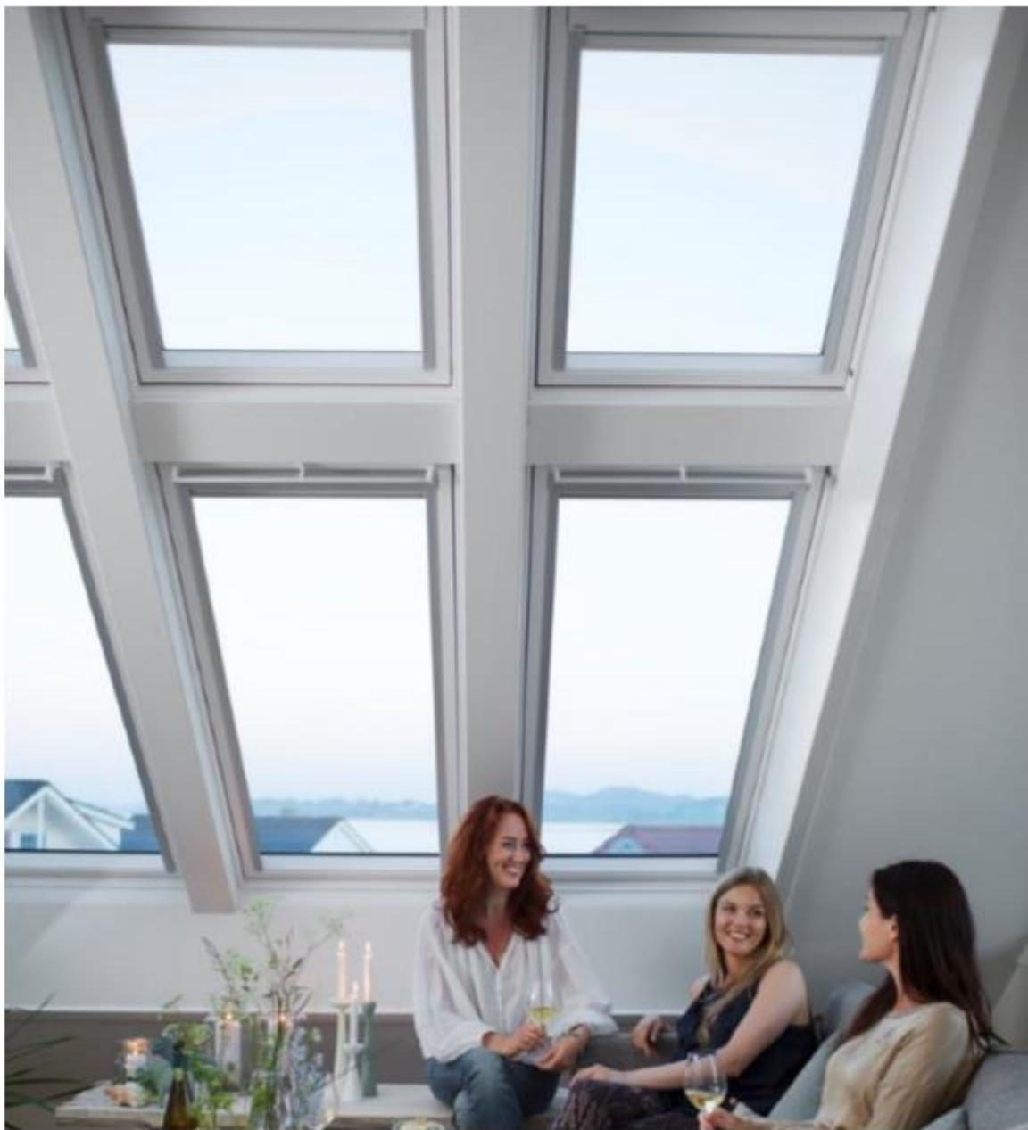
Verrière 2x3 avec 2 chevrons EKY