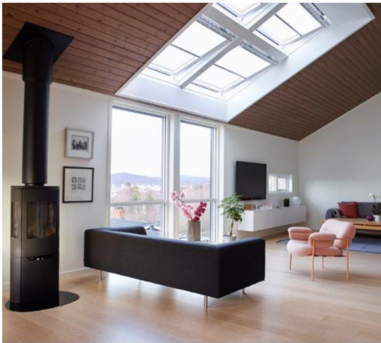
Verrière QUATTRO au-dessus de fenêtres verticales